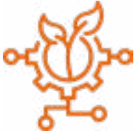
Ilustración 1. Actividades del sector primario