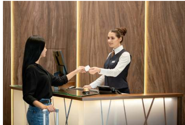
Tabla 4. Reformas al Impuesto sobre Hospedaje

En el caso del Impuesto sobre Hospedaje, se distinguieron modificaciones al marco normativo de la contribución en 6 entidades. Entre las reformas destacan los ajustes en las tasas y la consideración, dentro de los sujetos obligados de pago, de los prestadores de servicios a través de plataformas digitales en sus diversas modalidades. Cabe señalar que este gravamen es de suma relevancia sobre todo para aquellas entidades cuya dinámica económica se sustenta en las actividades turísticas. Las reformas al impuesto se muestran en la Tabla 4.