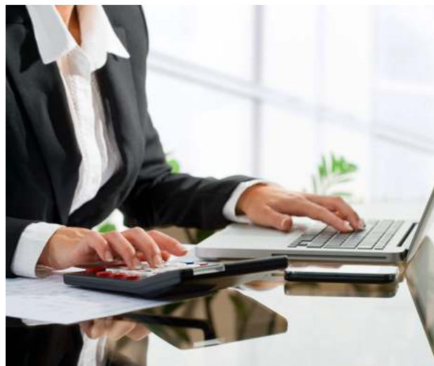
Tabla 3. Modificaciones al Impuesto sobre Nóminas

El Impuesto sobre Nóminas representa la contribución más relevante para las entidades federativas en términos recaudatorios. Para el ejercicio fiscal 2026, 10 entidades introdujeron reformas sobre este gravamen, enfocadas primordialmente al aumento de su tasa. Asimismo, se reconocen modificaciones en diversos elementos de la contribución como el objeto y sujeto. En el caso de Guanajuato, se modificó el destino de los recursos obtenidos por dicho impuesto. Las reformas mencionadas se detallan en la Tabla 3.