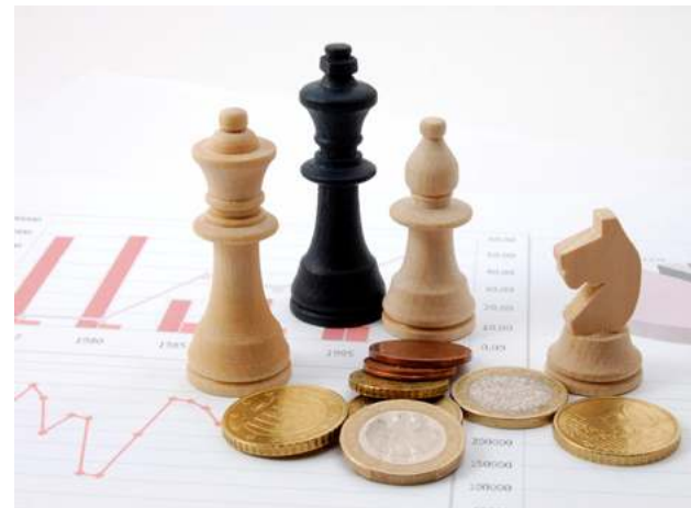
Tabla 7. Principales modificaciones en materia de derechos

Los derechos son la segunda fuente de ingresos propios más importante para las entidades federativas. Algunas entidades, para el ejercicio de 2026, igualmente introdujeron ajustes en su marco normativo hacendario para incluir una serie de cambios con el fin de adecuar los ordenamientos a las condiciones económicas actuales y a la creciente demanda de bienes públicos. Los ajustes esenciales, en materia de derechos, se presentan en la Tabla 7.